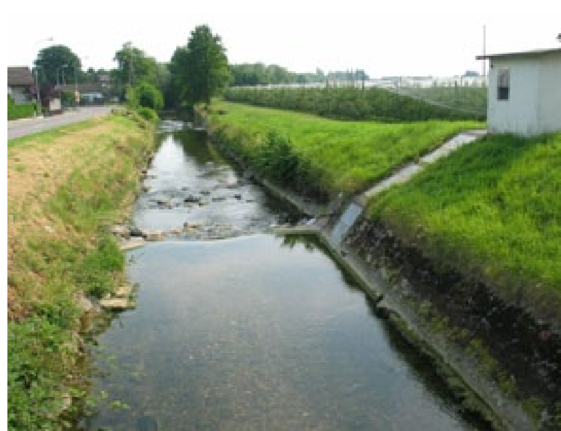
Für kanalisierte Abschnitte der Steinach sind Renaturierungsmassnahmen geplant.