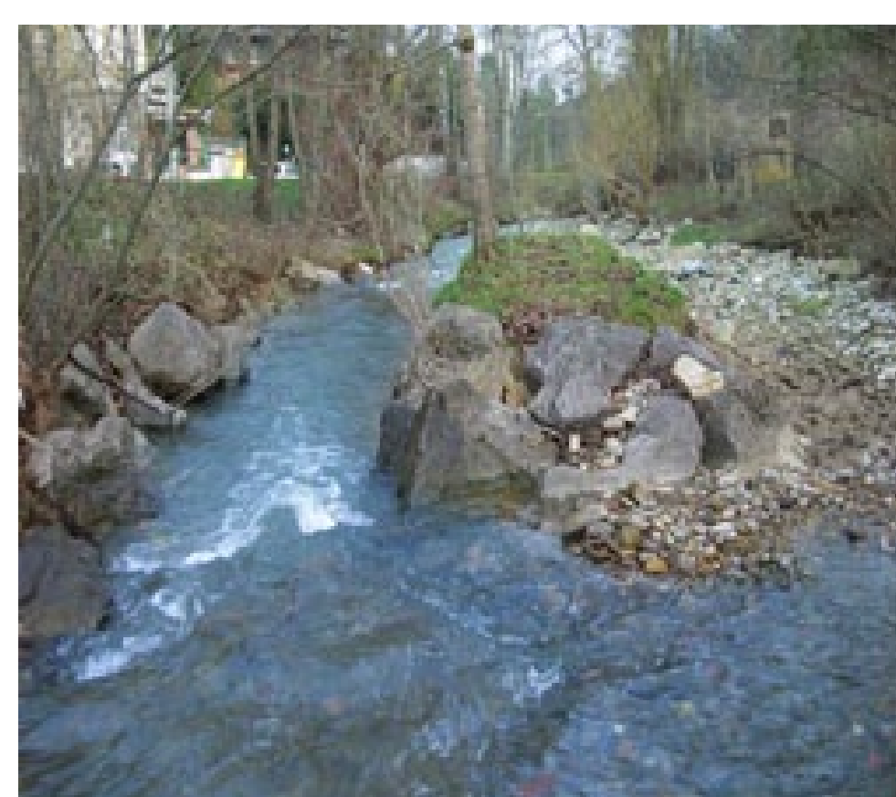
Renaturierter Abschnitt der Steinach in St.Gallen-St.Georgen